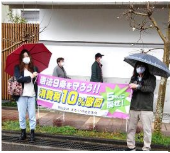
伊野税務署前で宣伝