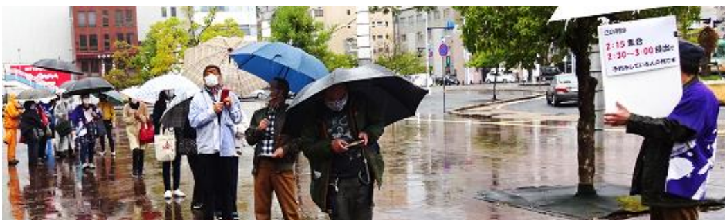
高知税務署に向かう参加者 (高知駅前広場)

3月12日(金)に、県内5ヶ所でコロナ対策を施しながら、重税反対統一行動が取り組まれ、あいにくの雨天でしたが785人が参加しました。安芸地区、香長地区(南国市)、県中央(高知市)の実行委員会は、集会が行わず集団申告のみ行いました。土佐・いの地区(いの町)、須崎地区の実行委員会は、短時間の小集会后集団申告を行いました。中村地区実行委員会は、3月26日に代表者が申告書を提出します。