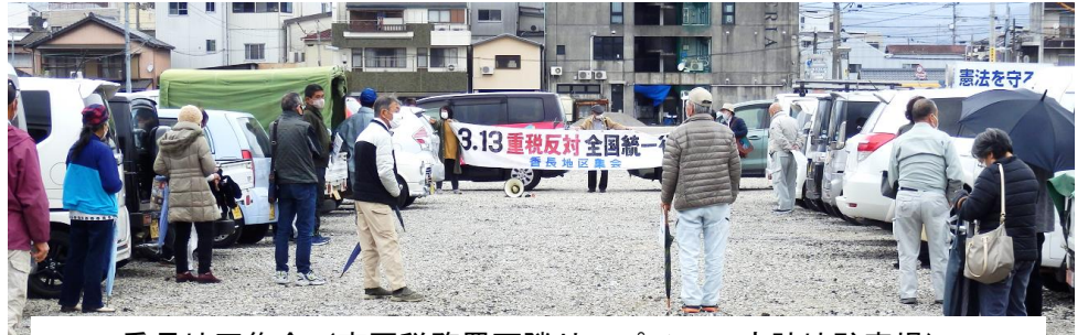
香長地区集会 (南国税務署西隣り・パチンコ店跡地駐車場)